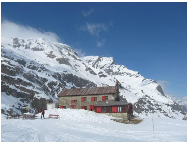
Koča Gian Federico Benevolo, 2285 m