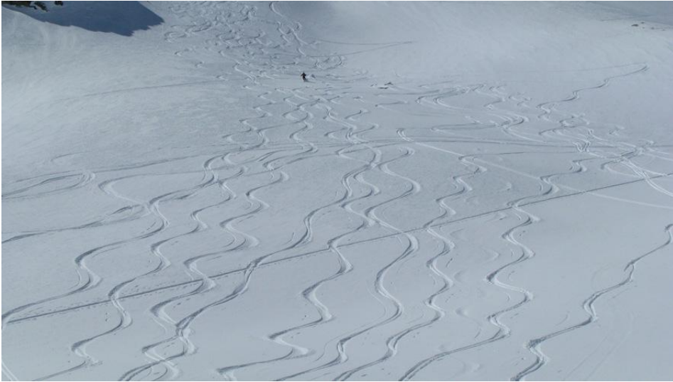
Odlične razmere za smuko