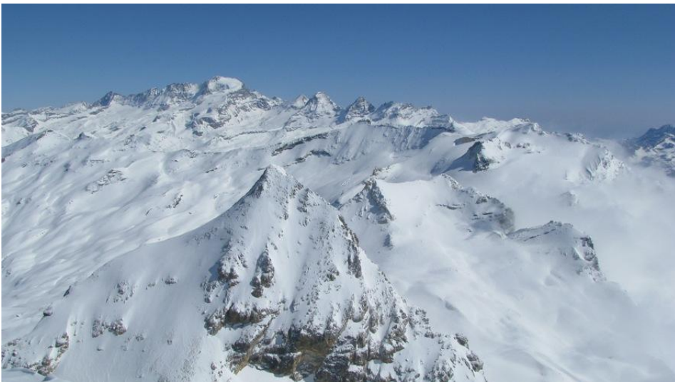
Pogled proti Gran Paradisu