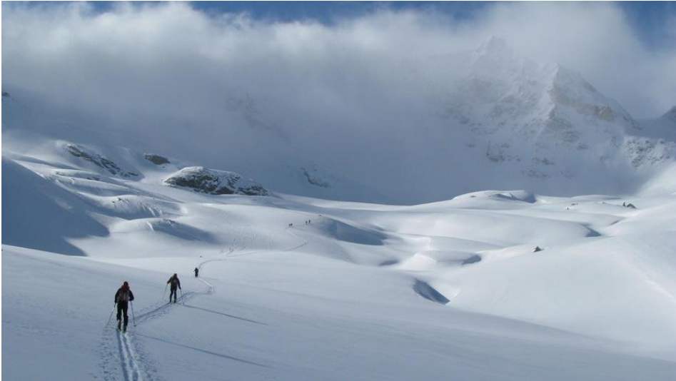
Proti Puntì Galisia

V vencu gora nad kočo Benevolo so vrhovi z nadmorsko višino od 3000 do 3500 metrov. Nad 2800 mnv se pričnejo ledeniki, vendar se da nevarnim delom izogniti, previdnost pa seveda ni odveč. Na večino vrhov se da priti s smučmi, nekateri pa so dosegljivi zgolj s plezanjem.